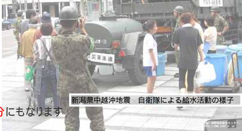
新潟県中越沖地震 自衛隊による給水活動の様子